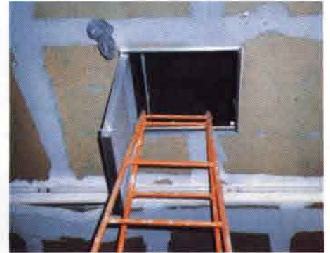
▲点検穴は1ヶ所15,000円材工共